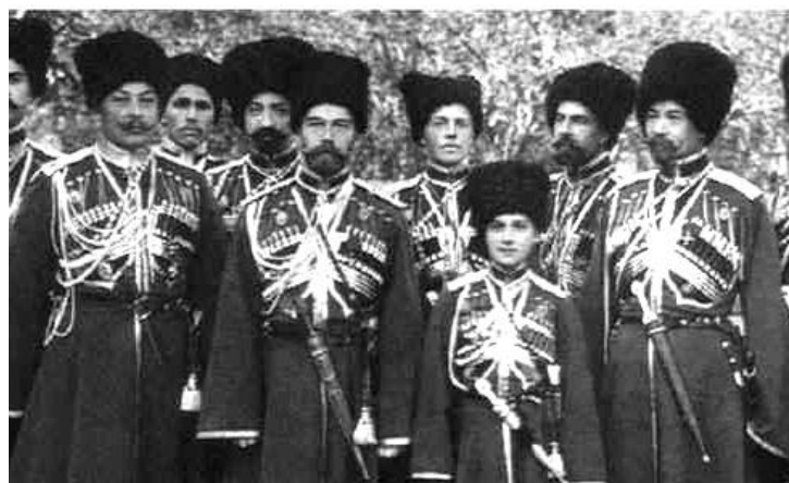
Император Николай II и наследник престола (в центре) среди казаков.

Терские казаки принимали активное участие в Русско-турецкой 1877-78 гг. и Русско-японской и первой мировой войнах. Всего в Терской области находилось 70 казачьих станиц, что составляло более 250 000 казаков. После Октябрьской революции 1917 г., терское казачество, оказавшись в огне Гражданской войны, выступило против Красной Армии, а в 1920 году терские казаки, как и другие казачьи войска, массово покинули Россию. Это произошло из-за того, что в 1920 году большевики приняли решение о выселении терских казачьих станиц, прилегающих к городу Грозному, и передаче их горцам. Та часть терцев, которая не эмигрировала за рубеж, была раскулачена и более 35 тысяч человек подверглась массовому уничтожению.